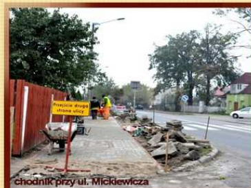
chodnik przy ul. Mickiewicza