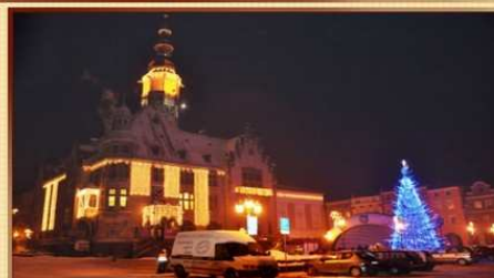
Iluminacje świąteczne w Ryнку.

- Inne inwestycje (m. in. wymiana ławek w Parku Miejskim, przygotowanie dokumentacji potrzebnej do przeprowadzenia zaplanowanych inwestycji, opracowanie koncepcji iluminacji w Ryнку, zakup wyposażenia technicznego, itp.)