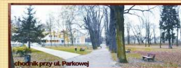
chodnik przy ul. Parkowej