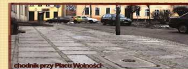
chodnik przy Placu Wolności