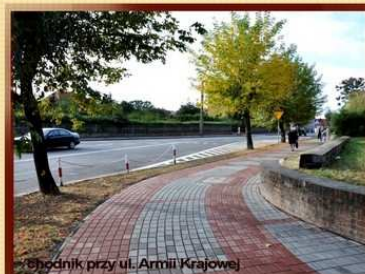
chodnik przy ul. Armii Krajowej